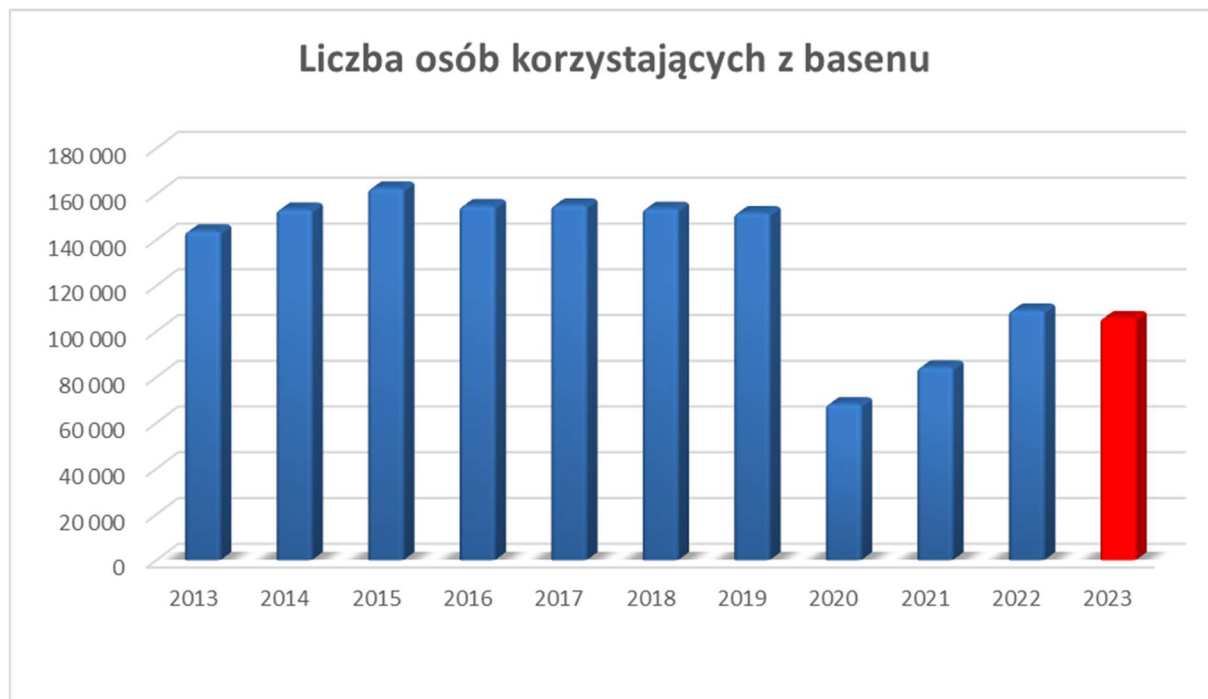
Wykres 2 Liczba osób korzystających z basenu w latach 2013 – 2023